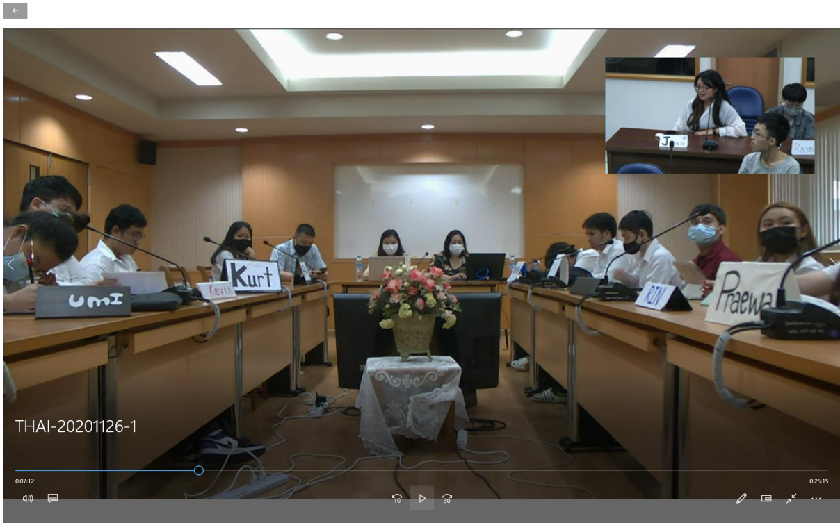
本校學生與泰國師生的視訊上課情形—台灣學生個別論述