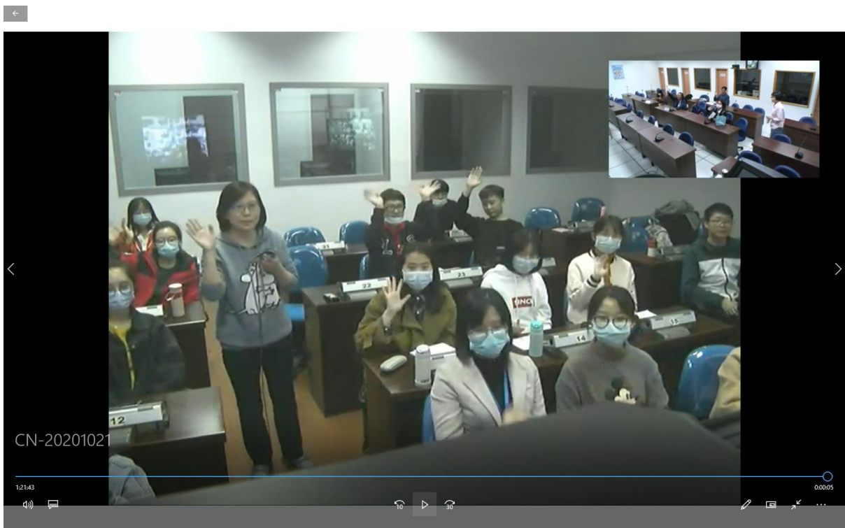
本校學生與北京第二外語學院研究所學生的視訊討論上課情形