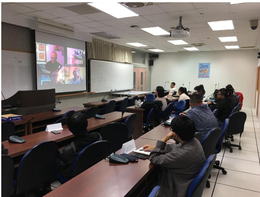
本校學生與美國師生的視訊討論上課情形